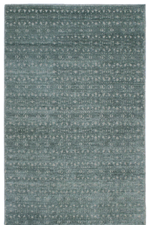
ATL 6182 Verde