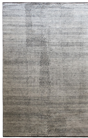
ATL 0058 Argento

I dati forniti in questa scheda tecnica sono aggiornati al momento della pubblicazione. Carpet Edition si riserva il diritto di modificare materiali, dimensioni e caratteristiche senza preavviso. The data provided in these technical specifications are up to date at the time of publication. Carpet Edition reserves the right to modify materials, sizes and characteristics without notice.