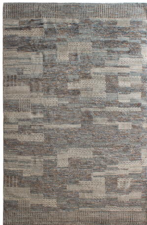
ATL 5083 Tortora/Jeans