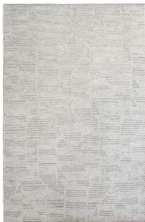
ATL 6244 Avorio

Disponibile su misura Custom sizes available