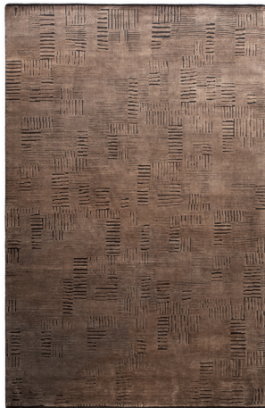
ATL 0035 Tabacco