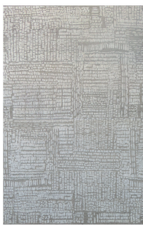
ATL 4006 Beige