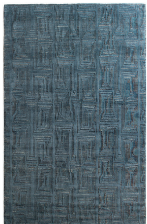
ATL 6177 Blu