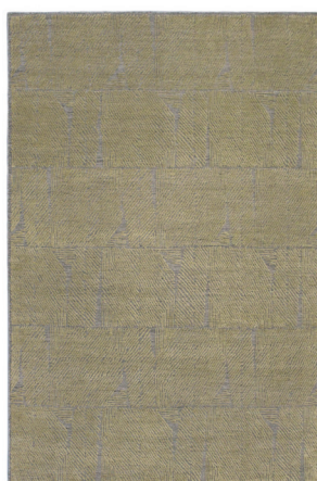
ATL 2524 Oro